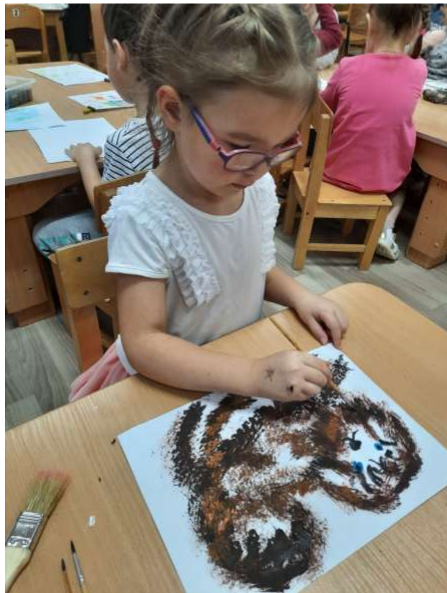
Рисуем весёлого щенка